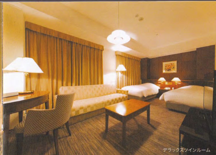
デラックスツインルーム