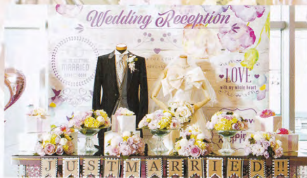
ウェディングチャペル「マリアージュ」