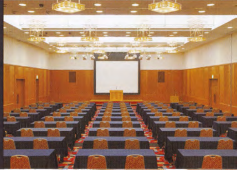
大ホール「ねぶたの間」